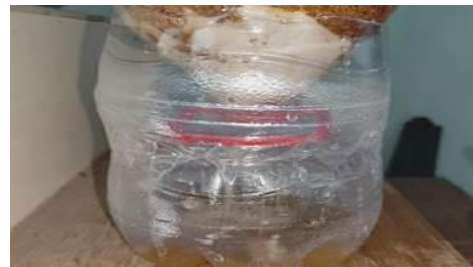
gambar 4. Hasil filtrasi menggunakan filter limbah organik

terlihat pada Gambar 4, menunjukkan peningkatan kualitas meski belum mencapai kejernihan optimal. Hal ini menunjukkan bahwa filter organik memerlukan perbaikan struktur dan aktivasi media untuk meningkatkan efektivitasnya.