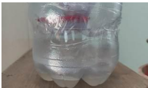
Gambar 3. Hasil filtrasi menggunakan filter konvensional

Hasil penelitian menunjukkan bahwa filter konvensional memberikan peningkatan kualitas air yang lebih signifikan dibandingkan filter berbahan limbah organik. Air yang disaring dengan media arang, pasir, dan kerikil terlihat lebih jernih, tembus pandang, dan hampir tidak berbau, dengan waktu filtrasi sekitar \pm 2 menit per 100 ml. Temuan ini selaras dengan Puspita et al. (2023) yang menyebutkan bahwa kombinasi pasir, karbon aktif, dan geotekstil mampu menyisihkan nilai permanganat hingga 66,64% dan total coliform hingga 50,17%. Hal tersebut menunjukkan bahwa media konvensional memiliki kemampuan adsorpsi dan penyaringan yang efektif untuk mengurangi partikel dan bau. Gambar 3 memperlihatkan hasil filtrasi yang jauh lebih baik dibandingkan kondisi awal. Dengan proses yang cepat dan stabil, filter konvensional terbukti paling efektif menghasilkan air yang mendekati kategori air bersih.