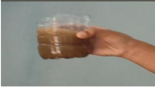
Gambar 2. Air keruh

Hasil penelitian menunjukkan bahwa filter konvensional memberikan peningkatan kualitas air yang lebih signifikan dibandingkan filter berbahan limbah organik. Air yang disaring dengan media arang, pasir, dan kerikil terlihat lebih jernih, tembus pandang, dan hampir tidak berbau, dengan waktu filtrasi sekitar \pm 2 menit per 100 ml. Temuan ini selaras dengan Puspita et al. (2023) yang menyebutkan bahwa kombinasi pasir, karbon aktif, dan geotekstil mampu menyisihkan nilai permanganat hingga 66,64% dan total coliform hingga 50,17%. Hal tersebut menunjukkan bahwa media konvensional memiliki kemampuan adsorpsi dan penyaringan yang efektif untuk mengurangi partikel dan bau. Gambar 3 memperlihatkan hasil filtrasi yang jauh lebih baik dibandingkan kondisi awal. Dengan proses yang cepat dan stabil, filter konvensional terbukti paling efektif menghasilkan air yang mendekati kategori air bersih.